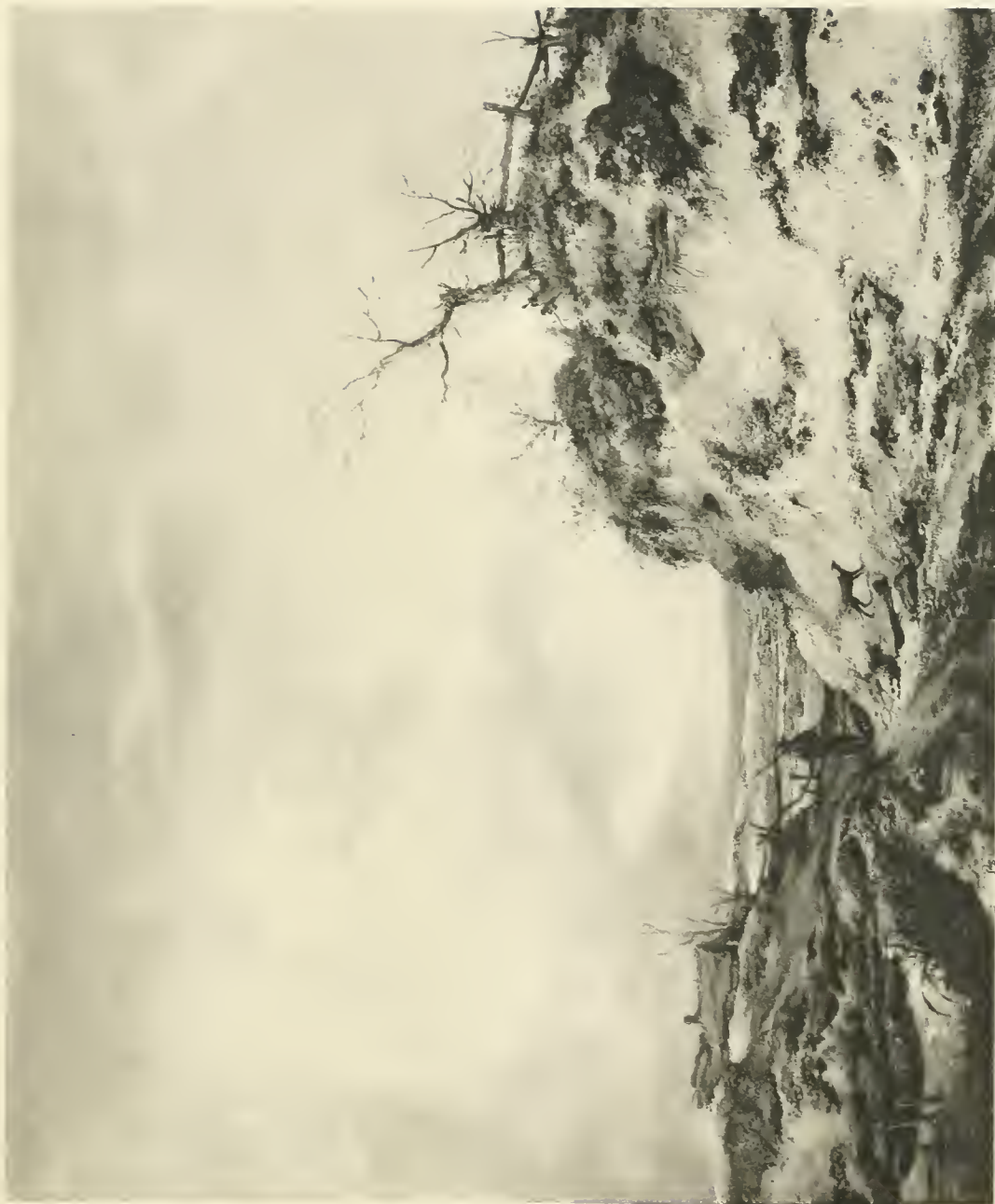
P. H. WOUWERMAN

TERCENTENAIRE DE REMBRANDT - EXPOSITION FREDERIK MULLER & CIE.